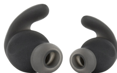
M S Ergonomische Sport-Ohrpasstücke